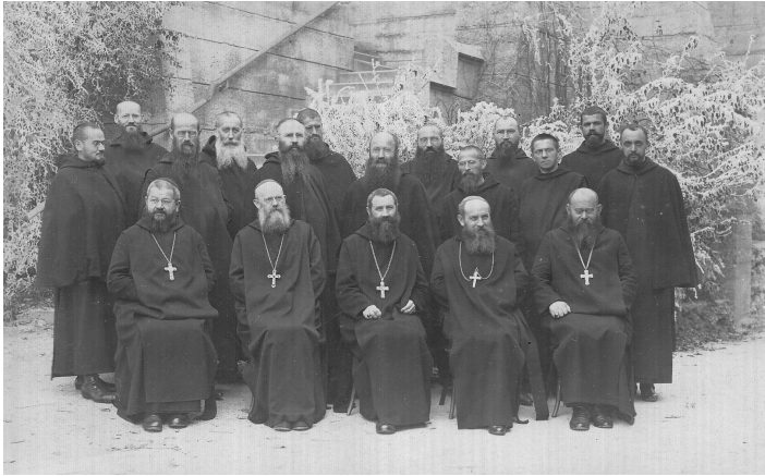
Omnes participes Capituli generalis anni 1921 i .

Primarius scopus Capituli generalis scilicet erant Constitutiones, quā de causā singulis in sessionibus declarationes atque statuta diligenter tractabantur. Tamen in Capitulo speciali anni 1921 i res tam bene iam praeparata erat, ut textus illo tempore exaratus solum paucis parvisque mutationibus factis ab participibus Capituli generalis comprobaretur. 63 Itaque capitulares unanimiter